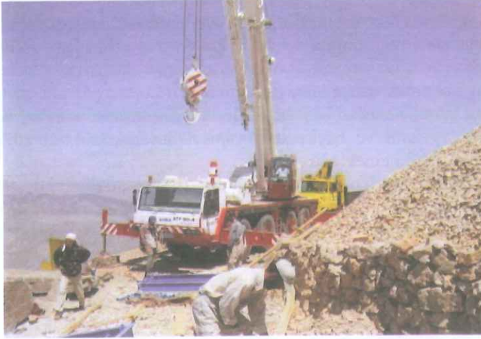
Fotoğraf-5: Çalışmalarda kullanılan vinç