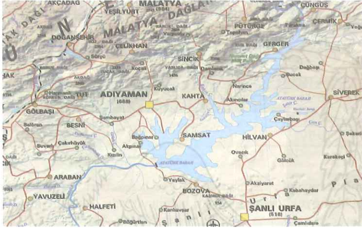
Şekil-1: Nemrut Dağı'nın coğrafi konumu

Kâhta İlçesi'nin denizden ortalama yükseltisi 750 metredir. Kuzeyde yüksekliği 2000 metreyi aşan sıra dağlarla çevrili olan ilçe, 1490 km 2 'lik yüzölçüme sahiptir. İlçenin kuzey kesimi dağlık alanlardan meydana gelirken, güney kesimi düzlük alanlardan oluşmaktadır. Kuzeydeki en yüksek nokta Nemrut Dağı'dır (2206 m). Dağlık alanlardan güneye doğru gidildikçe önce plato alanlarına, sonra geniş ova kesimine geçilir. İlçe yüzölçümünün Nemrut Dağı Tümülsü'nü de içine alan yaklaşık üçte ikilik kesimi 1. derecede, geri kalan yaklaşık üçte biri ise 2. derecede deprem bölgesi içindedir.