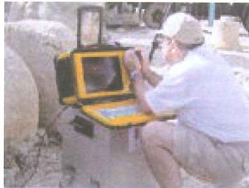
Fotoğraf-3 ve 4: D Lazer Callidus kullanılıyor ( http://www.nemrud.nl/tr/nw_tekst1.asp , 22-8-2001)

Uluslararası Nemrud Vakfı’nın web sitesinin “Nemrud’un Günlüğü” bölümünde verilen 2001 yılı fotoğraflarından Tümülüs’ün hemen eteğinden geçen ve pek çok kez ilgili Adana Kültür ve Tabiat Varlıklarını Koruma Bölge Kurulu (AKTVKKB) kararına konu olmuş olan yolun bu süreçte kullanıldığı, alanda 2001 yılından itibaren vinç kullanıldığı UNV’nın web sitesindeki fotoğraflardan anlaşılmaktadır ( http://www.nemrud.nl , bkz. bölüm “günlüğü”) (Fotoğraf-5).